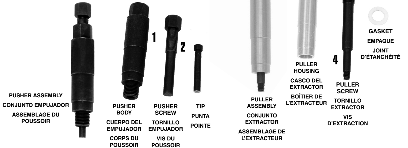
PUSHER ASSEMBLY CONJUNTO EMPUJADOR ASSEMBLAGE DU POUSSOIR

Make sure porcelain is broken off flush inside spark plug tip. Asegúrese que la porcelana esté rota a ras dentro de la punta de la bujía. S'assurer que la porcelaine est brisée à ras dans le bout de la bougie d'allumage.