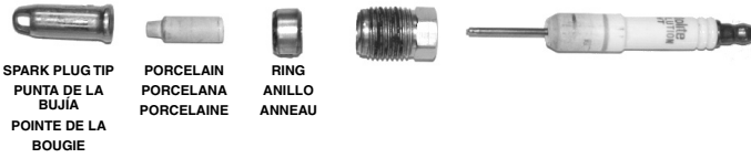
SPARK PLUG TIP PUNTA DE LA BUJÍA POINTE DE LA BOUGIE PORCELAIN PORCELANA PORCELAINÉ RING ANILLO ANNEAU

Make sure porcelain is broken off flush inside spark plug tip. Asegúrese que la porcelana esté rota a ras dentro de la punta de la bujía. S'assurer que la porcelaine est brisée à ras dans le bout de la bougie d'allumage.